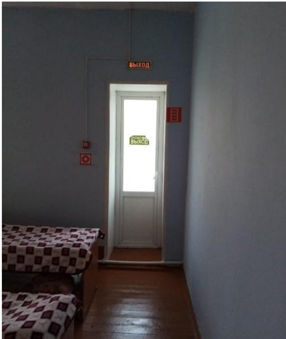
Фото №14 (система информации и связи), (визуальные средства)