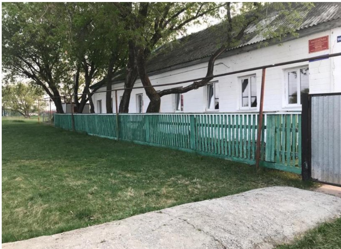
Фото №4 (территория, прилегающая к зданию)